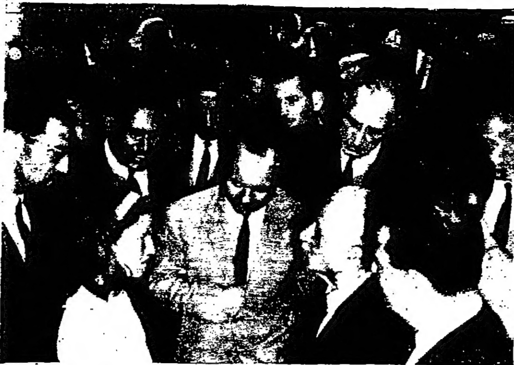
السيد عبد الحميد البكوش رئيس وزراء ليبيا والسيد أحمد طوفان نائب رئيس وزراء الأردن يتحدثان في مقهى القيتات في مخيم الجفنة